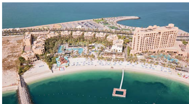
Luftaufnahme der Strandstraße und der Resorts der Insel Marjan

Eine ganze Reihe herrlicher Strände beherbergt die aufgeschüttete Insel Al Marjan. Der öffentliche Al Marjan Island Beach ist einer der beliebtesten in Ras al Khaimah. Gleich 2 Geheimtipps befinden sich an der Nordküste des Emirats: der flach abfallende und damit besonders familienfreundliche Al Rams Beach und die Insel Saraya. Beide gefallen mit malerischen Sandbänken und gewähren dabei einen imposanten Blick auf das Hadschar-Gebirge. Wer planschen, sonnenbaden oder Stand-up-paddeln will, findet hier sein Strandparadies.