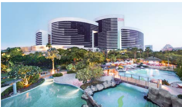
Badeparadies vor Stadtkulisse

Ein Stadthotel unweit des Dubai Creek, das es locker mit erstklassigen Badehotels aufnehmen kann: das Grand Hyatt Dubai ♦♦♦♦. Herzstück der aus 3 Swimmingpools bestehenden Oasen-Landschaft ist einer der größten Pools in Dubai. Dazu große Familienzimmer, Hallenbad und Kinderpool mit Rutschen und großem Spielplatz und das Familienparadies ist perfekt. Prädikat: Spritzig – mit Top-Preis-Leistungs-Verhältnis!