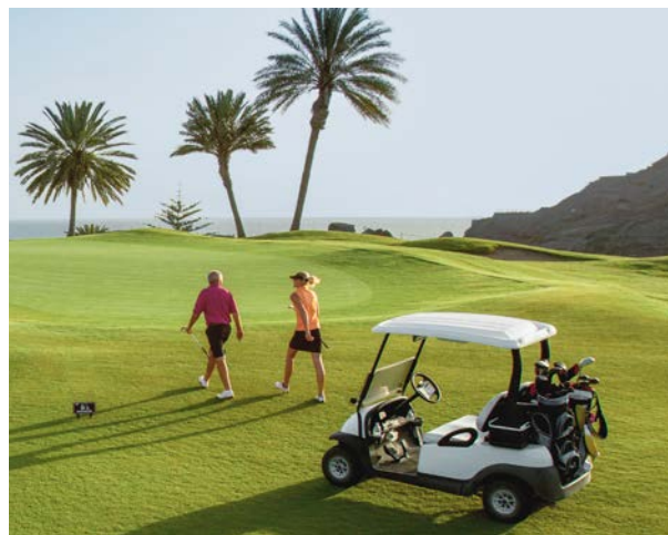
Auch die Golf-Anlagen spielen auf internationalem Top-Niveau

Golfen mit Skyline-Blick und Party-Atmosphäre ist bei Topgolf Dubai angesagt. Ziel ist es, aus dem 3-stöckigen offenen Gebäude heraus verschiedene Golf-Herausforderungen zu meistern. Der Clou: Microchips in den Golfbällen übertragen Lage und Spielergebnis auf den Monitor. Die 96 klimatisierten Kabinen erinnern dabei an den Anlaufbereich einer Bowling-Bahn. Restaurants, Live-Musik und vieles mehr machen das außergewöhnliche Erlebnis perfekt.