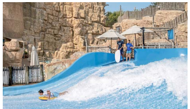
Wild Wadi Wasserpark

Das größte Wellenbad der VAE, Wildwasserbahnen und eine rund 120 Meter lange Tandemrutsche, die Geschwindigkeiten bis zu 80 Stundenkilometer möglich macht, gehören zu den spritzigen Highlights von Wild Wadi. Der Wasserpark ist direkt an das familienfreundliche Jumeirah Beach Hotel ♦♦♦♦♦ angeschlossen und für die Gäste aller Jumeirah-Hotels kostenfrei zugänglich.