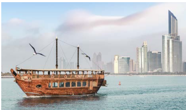
Traditionelles Dhau-Boot in Abu Dhabi

Eislaufen in der Marina Mall, Warner Bros. World, Wüsten-Safari oder ein Wander- oder Kajak-Ausflug in das Ökosystem der Mangrovenwälder: In Abu Dhabi kommt keine Langeweile auf – schon gar nicht bei Kindern. Ein besonderes und dabei sehr entspanntes Erlebnis ist eine Fahrt mit einer Dhau, einem der traditionellen Segelschiffe. Da werden aus Kindern echte Abenteurer und Prinzessinnen wie aus einem Märchen.