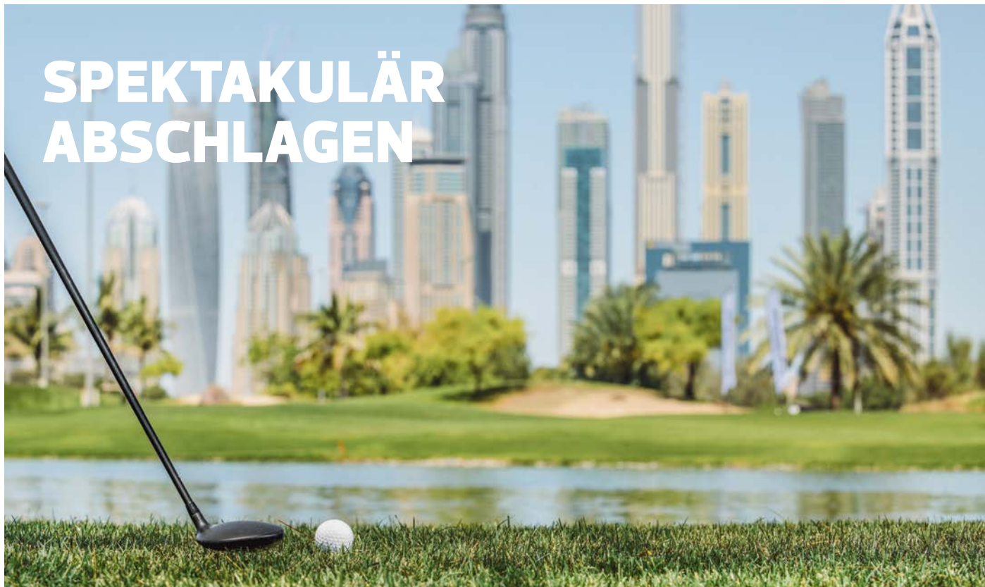
Abschlag mit Aussicht: Immer die Skyline im Blick

Einzigartige Golf-Anlagen vor einer atemberaubenden Stadtkulisse, Kurse auf Weltklasse-Niveau und praktisch das gesamte Jahr über warmes Sommerwetter – die Golfplätze in Dubai haben alles, was das Herz eines passionierten Golfers höherschlagen lässt. Und das auf insgesamt 13 verschiedenen Golfplätzen – mal in einer üppigen Parkanlage, mal in der Wüste, am Strand oder sogar in ganz futuristischem Ambiente.