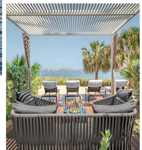
Banyan Tree Dubai

In Dubai herrscht das ganze Jahr über Badewetter. Wie gut, dass das Emirat von zahlreichen Traumstränden umsäumt ist, die mit einer Abkühlung in den Wellen des Arabischen Golfs locken. Eine Auswahl an Hotels in direkter Strandlage sorgt für entspannte Momente – sei es beim Relaxen im Schatten der Palmen, beim Bau von rekordverdächtigen Sandburgen oder beim erfrischenden Bad im klaren Wasser.