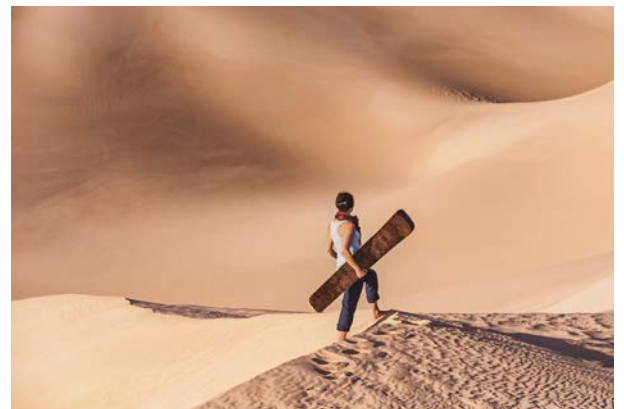
Mit dem Board die Dünen erkunden

Es gibt viele Möglichkeiten, die Wüste zu erobern. Die angesagteste ist Sandboarding. Ähnlich dem Snowboarding geht es auf einem Board steil hinab – allerdings auf Sand. Der Trendsport in den Dünen ist ein actionreicher Spaß, für Könner ebenso wie für Anfänger oder Kinder. Wer hier einmal fällt, fällt weich. Als bester Ort fürs Sandboarden gilt die Oase Al Marmoom, beeindruckend hohe Sandberge bietet die Oase Al Badayer mit der rund 300 Meter hohen Düne Big Red. Die Sweihan-Wüste auf der Strecke nach Abu Dhabi, Lahbab- und Al-Aweer-Wüste mit etwas niedrigeren Dünen sind weitere Spots fürs Surfen im Sand.