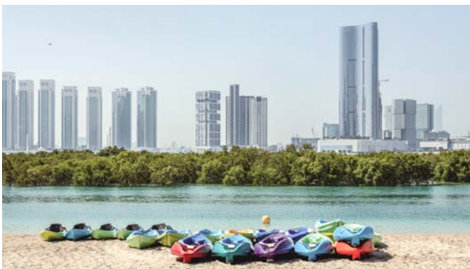
Paddelboards und Kajaks vor der Skyline Abu Dhabis

Wenn die Flut das Wasser in die Mangroven-Kanäle zurückbringt, erwacht das Biotop zum Leben. Dann tummeln sich zahlreiche Meeresbewohner wie Fische, Krebse und Schildkröten zwischen den Wurzeln. Auch für Erkundungs-Touren ist das die ideale Zeit, denn dann gibt es jede Menge zu beobachten. Ob beim Stand-up-Paddling, auf einer Bootstour oder beim Schwimmen – die Mangroven lassen sich auf viele Arten erkunden. Beliebt sind auch Kajak-Ausflüge, diese können auch bei Nacht unternommen werden. Eine Mangroven-Tour bei Mondlicht? Ein einzigartiges Erlebnis!