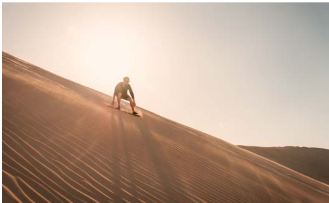
Sandboarding: Mit Speed geht es die Düne hinunter