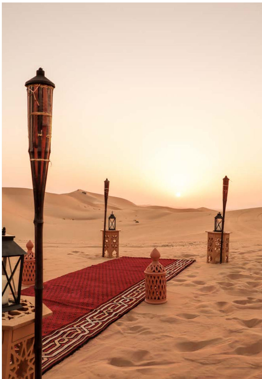
Genuss-Oase in der Wüste: das stilvolle Sonara Camp

Die reiche Landeshauptstadt setzt auf eine Mischung aus Kultur, Natur und Unterhaltung. Erlesene Museen wie der Louvre Abu Dhabi wechseln mit Top-Adressen wie Ferrari-World und Warner Bros. World und erstklassigen Stränden. Dazu locken im größten der Emirate grüne Mangrovenwälder sowie Gartenstädte und Abenteuer in der Wüste.