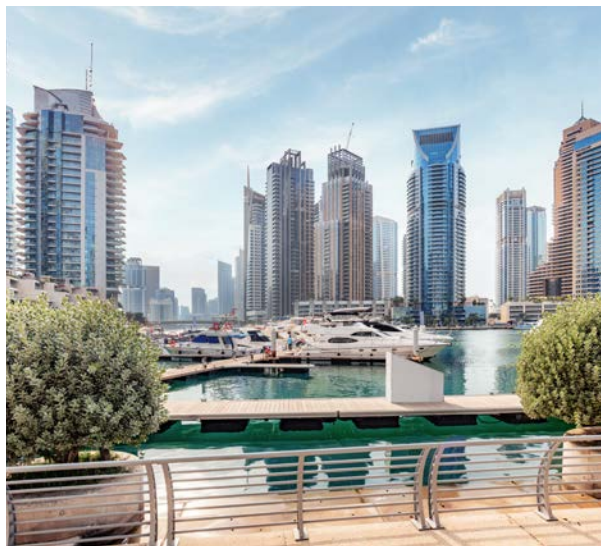
Spektakuläres Panorama: Die Dubai Marina

Dieser Ausflug ist in deinem Reisebüro buchbar. Yellow Boat Cruise (DXB88810)