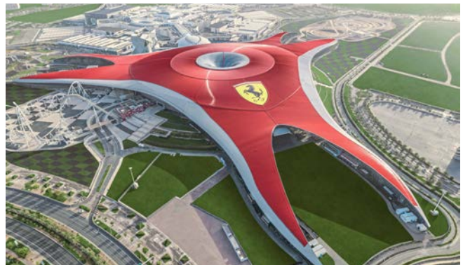
Ferrari World Abu Dhabi

Mit der Ferrari World Abu Dhabi findet sich auf Yas Island der erste Ferrari-Themenpark der Welt. Noch mehr Spaß für Rennsport-Fans gibt es auf dem Yas Marina Circuit, wo einmal im Jahr die Formel-1-Elite beim Großen Preis von Abu Dhabi gastiert. Hier können auch Fans ihre Fahrkünste unter Beweis stellen und im Rennwagen, Oldtimer, Kart, Dragster oder sogar mit dem Fahrrad über die Rennpiste fahren.