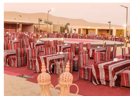
Sonara Camp, Genuss-Oase

Die Wüste gehört zu Dubai wie ein Dessert zu einem guten Dinner. Wer auf der Suche nach einem exklusiven kulinarischen Erlebnis mit einem Hauch Abenteuer zwischen den Dünen ist, findet im Sonara Camp wortwörtlich seine Genuss-Oase. Mit den Füßen im Sand kannst du hier in entspannter Atmosphäre bei Kerzenlicht eines der sorgfältig zusammengestellten Menüs genießen und in einem der loungeartigen Sitzbereiche den endlosen Sternenhimmel auf dich wirken lassen.