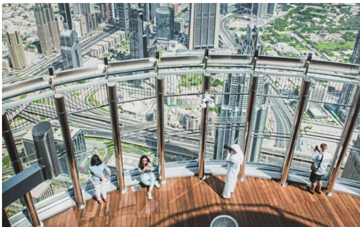
Burj Khalifa Aussichtsplattform

Wenn es um Größe geht, scheint Dubai einen Rekord nach dem anderen aus dem Sand zu stampfen. Natürlich steht auch das höchste Gebäude der Welt, der Burj Khalifa, im Emirat. Neben weiteren Weltrekorden wie der höchsten Aussichtsplattform im Freien wird es stilet gesäumt von der größten Wasserfontäne sowie dem größten Einkaufszentrum der Welt. Doch was beherbergt das 828 Meter hohe Gebäude eigentlich? Zeit für einen Aufstieg auf den höchsten Turm der Erde.