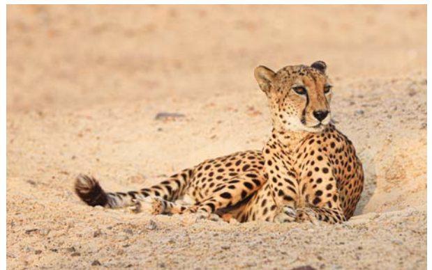
Gepard im Sir Bani Yas Wildlife Park