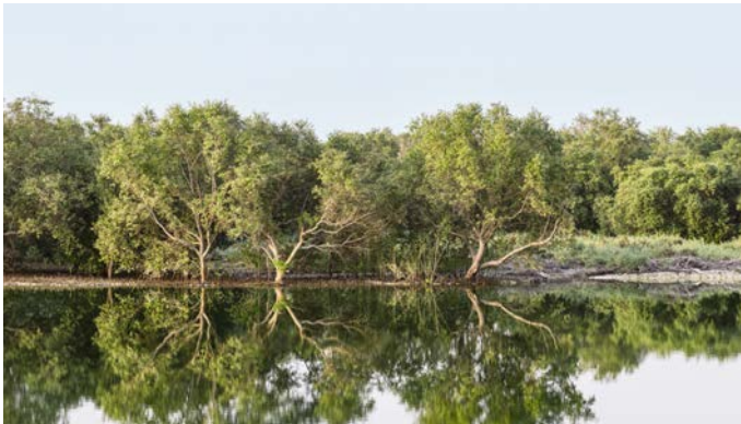
Mangroven schützen die Küstenlinie vor Erosion

Es sind die einzigen Bäume der Welt, die in Salzwasser überleben können, und damit sind Mangroven wertvolle Hüter des Ökosystems. Mit ihren bizarr geformten Wurzeln schützen sie die Küste vor Erosion und binden bis zu fünfmal mehr CO 2 als andere Bäume. Sie widerstehen problemlos dem Wechsel von Überflutung und Trockenheit, denn sie sind Tag für Tag dem Wechsel der Gezeiten ausgesetzt.