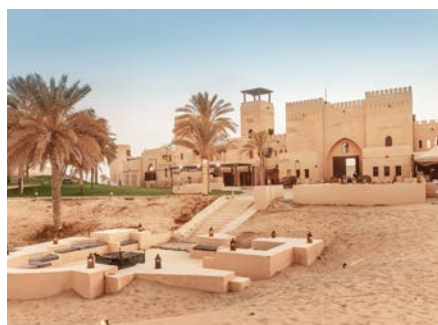
Ausflüge in die Wüste: Heritage Village

Geruhsamer geht es bei einem Ausflug zu einem der Heritage Villages zu. In der Wüste gibt es mehrere dieser Dörfer. Besonders eindrucksvoll: das Hatta Heritage Village im Hadschar-Gebirge. Die Häuser des rekonstruierten Dorfes sind aus Lehm, Palmwedeln und Baumstämmen, Schilf und Steinen erbaut und vermitteln einen Eindruck von der ursprünglichen Lebensweise in der Wüste. Das Al Marmoom Heritage Village bietet im Frühjahr sogar ein Festival mit reichlich Folklore.