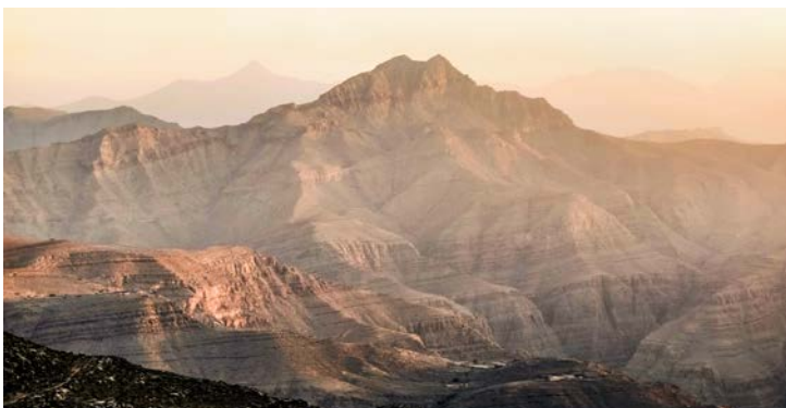
Aussicht, 1484 by Puro