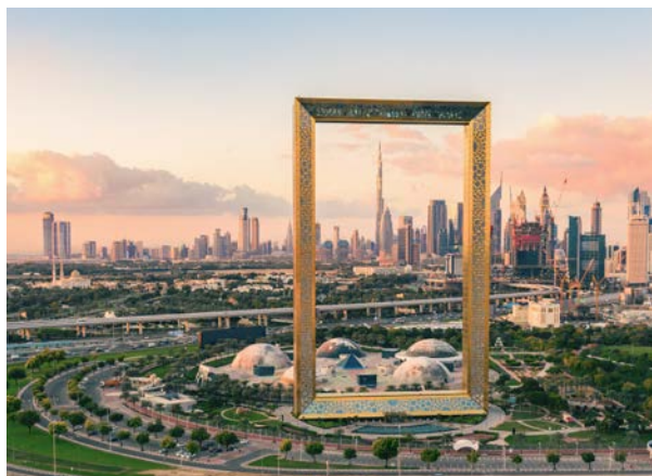
Der größte Bilderrahmen der Welt – natürlich: Dubai Frame

Wie ein gigantischer goldglänzender Bilderrahmen setzt das Gebäude „Dubai Frame“ die moderne Skyline von Downtown Dubai im Süden und das historische Viertel von Deira im Norden in Szene. Traditioneller geht es am Dubai Creek zu, das auch als das alte Herz der Stadt bekannt ist. Es lohnt sich, mit einem Abra, dem traditionellen Wasser-taxi, über den Fluss zu fahren, die bunten Souks zu besuchen und sich einfach zwischen Einheimischen von Stand zu Stand treiben zu lassen und die Gewürze und traditionelle Handwerkskunst zu entdecken.